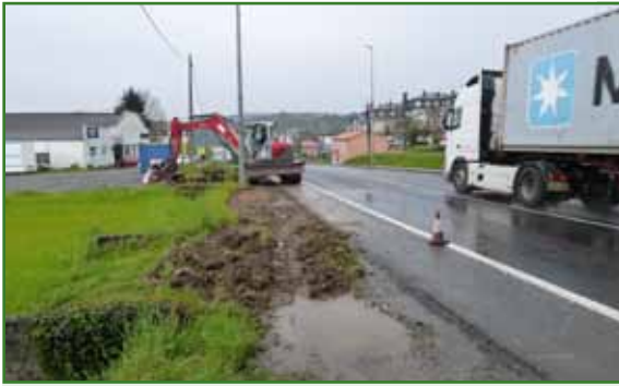
Instalarase unha baranda de seguridade ata rotonda