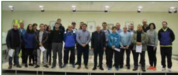
Sinatura dos convenios de colaboración