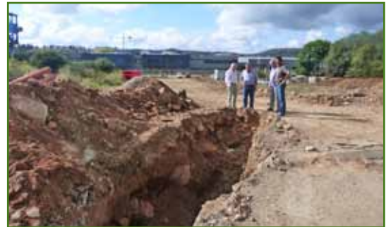
O Concello e a Xunta de Compensación Urbanística da Área de Reparto Nº 1 están a executar as obras de urbanización en tempo récord

Pese a estes últimos atrancos, o Concello de Oroso cumpríu puntualmente cos seus compromisos para que o colexio poda abrir as súas portas. Agora centrarase en mellorar os accesos ao centro, entre os que se inclúe unha senda peonil dende a rúa do Portiño que comunicará coa gardería da Ulloa e as beirarrúas da N-550. Xusto enfronte, acometerá unhas beirarrúas dende os talleres ata a chegada ao centro escolar. O Ministerio de Fomento será quen decida onde se coloca o novo paso de peóns para os rapaces que veñan da outra marxe da N-550.