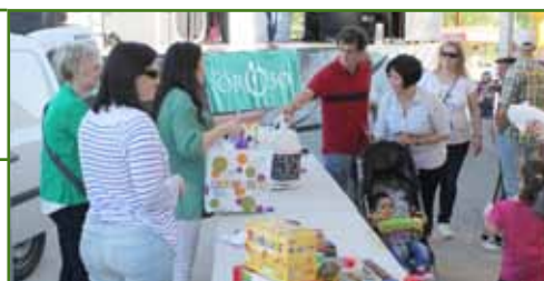
Os Servizos Sociais de Oroso recolleron máis de 1.500 kg de alimentos e produtos de hixiene

Dende o Concello de Oroso queremos darvos as nosas máis expresivas grazas a todos os que fixéchedes posible o éxito da I Gala da Solidariedade : máis de 1.500 quilos de alimentos e produtos de hixiene. E grazas tamén a todos os artistas, entidades, empresas e asociacións que colaboráchedes desinteresadamente.