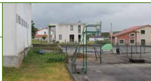
As obras céntranse na da área de xogos