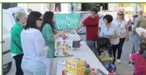
Os Servizos Sociais de Oroso recolleron máis de 1.500 kg de alimentos e produtos de hixiene

Dende o Concello de Oroso queremos darvos as nosas máis expresivas grazas a todos os que fixéchedes posible o éxito da I Gala da Solidariedade : máis de 1.500 quilos de alimentos e produtos de hixiene. E grazas tamén a todos os artistas, entidades, empresas e asociacións que colaboráchedes desinteresadamente.