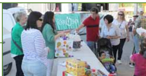
Os Servizos Sociais de Oroso recolleron máis de 1.500 kg de alimentos e produtos de hixiene

Dende o Concello de Oroso queremos darvos as nosas máis expresivas grazas a todos os que fixéchedes posible o éxito da I Gala da Solidariedade : máis de 1.500 quilos de alimentos e produtos de hixiene. E grazas tamén a todos os artistas, entidades, empresas e asociacións que colaboráchedes desinteresadamente.