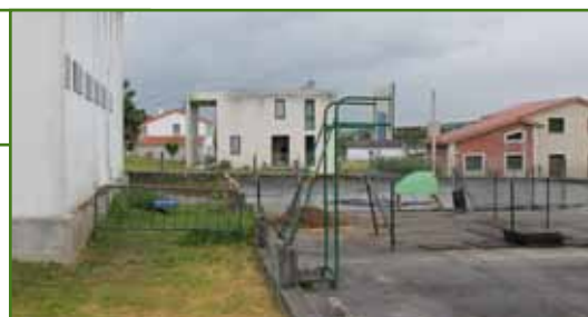
As obras céntranse na da área de xogos